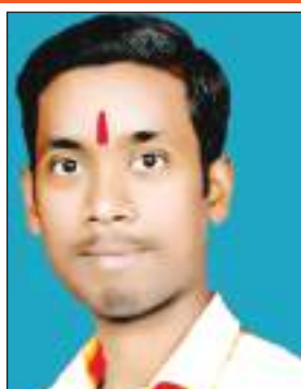
रखेंगे। पृथ्वीराज चौहान हमेशा हमारे प्रेरणा स्रोत रहेंगे। सम्राट