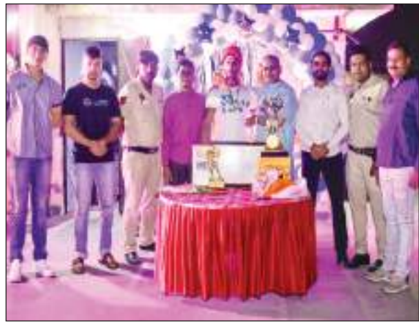
हमारे क्षेत्र की शान हैं, जिन्होंने यह बड़ी प्रतियोगिता मिस्टर इंडिया 2023 में प्रथम स्थान पाया। उन्होंने बताया कि इससे पूर्व भी अनेक