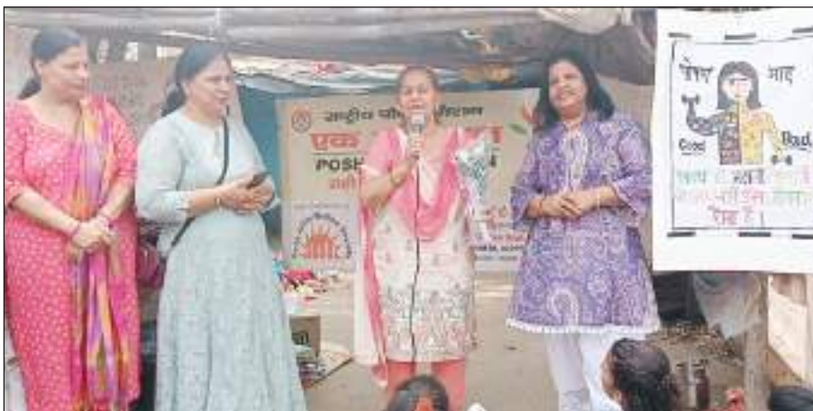
टीम एक्शन इंडिया/नई दिल्ली ज्ञान आधार वेलफेयर सोसायटी के द्वारा शालीमार बाग और पीतमपुरा के पास सीए ब्लॉक के स्लम इलाकों में मदर्स डे और पोषण माह मनाया। बच्चों में कुपोषण के