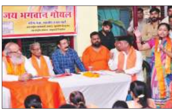
बेटियों को बहलाकर, फुसलाकर लड़के यहाँ से भगाकर ले जा रहे हैं। गलियों में कई-कई मजिले अवैध निर्माण करके बाहरी लोगों को थोक के भाव यहाँ बसाया जा रहा है, काम धंधा व स्कूल कॉलेज में जाने वाली लड़कियों को आए दिन इन लोगों की बदतमिजी का सामना करना पड़ रहा है।

टीम एक्शन इंडिया/नई दिल्ली यूनाइटेड हिन्दू फ्रंट ने आम लोगों की समस्याएं जानने और सुनने के लिए शहरी पंचायतों के आयोजन की मुहिम शुरू कर रखी है। जिसके तहत श्री राधा कृष्ण मंदिर, बी ब्लॉक, बूजपुरी, मुस्तफाबाद विधानसभा क्षेत्र में शहरी पंचायत का आयोजन किया गया। जिसमें यूनाइटेड हिन्दू फ्रंट के अंतर्राष्ट्रीय कार्यकारी अध्यक्ष और राष्ट्रवादी शिवसेना के राष्ट्रीय अध्यक्ष व वरिष्ठ नेता, भारतीय जनता पार्टी जय भगवान गोयल ने 2:30 घंटे बैठकर क्षेत्रीय लोगों की समस्याओं को सुना। लोगों ने बताया कि आए दिन हमारी बहन-