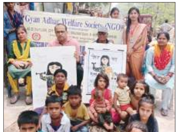
सभी को पोषाहार सामग्री परोसी गई। स्कूल प्रवेश जागरूकता कार्यक्रम को लेकर बच्चों द्वारा रैली भी निकाली गई। संस्था के सदस्य इसको लेकर डोर टू डोर कैम्पन शुरू कर रहे हैं और लोगों को स्कूल